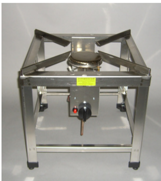
Mit Standard-Reglergarnitur 1,5 kg Best.Nr. 99008272