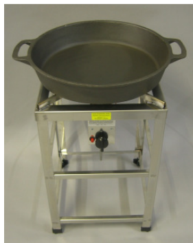
Compl. mit * Gußbrat-Pfanne Ø 50 cm * Hockerkocher K 72 * Standard-Reglergarnitur 1,5 kg